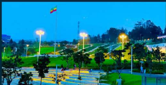
የጉለሌ አከባቢ ጥበቃ ጽ/ቤት መጽሔት

በወንዞች ብክለት ምክንያት ጉዳት የደረሰበት ሰው በብክለቱ ምክንያት ጉዳት እንደ ደረሰበት በማስረዳት ለደረሰበት ጉዳት ካሳ የመጠየቅ መብት አለው።