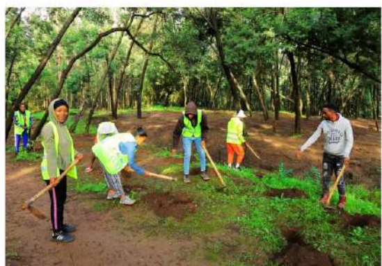
ነገን ዛሬ እንትከል !!